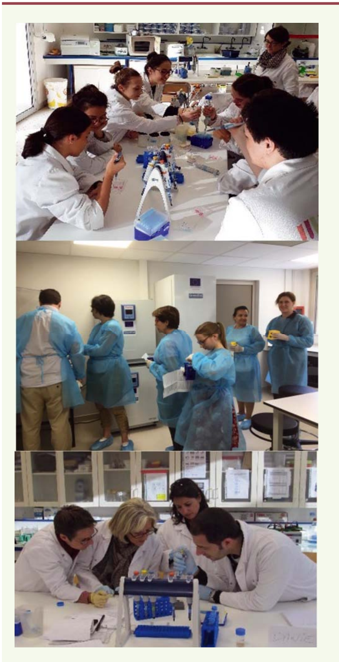
Figure 1. De haut en bas : scolaires, grand public ou membres d'association de malades effectuant des expériences par équipe, dans les laboratoires ouverts Tous Chercheurs.

stage par l'analyse du résultat de la même expérience (il s'agissait dans ce cas de l'observation au microscope confocal de macrophages dans une coupe de peau lésée). Une fois définis les mots incompris, les élèves décrivent aux tuteurs ce qu'ils voient et tentent d'apporter des réponses possibles aux interrogations inhérentes aux observations qui ont été faites. À l'issue de cette étape, émerge la problématique : « Quelles sont les réponses possibles du macrophage face à une infec-